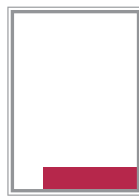
Format 7 124 x 43 mm 200 EUR