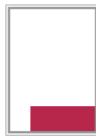
Format 6 124 x 62 mm 300 EUR