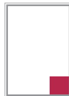
Format 10* 59 x 62 mm 155 EUR

Malstaffel: ab 2 Anzeigen 05% ab 3 Anzeigen 10% ab 4 Anzeigen 15%