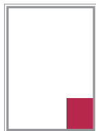
Format 9 59 x 83 mm 195 EUR