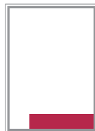
Format 7 124 x 43 mm 200 EUR