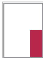
Format 8 59 x 129 mm 300 EUR