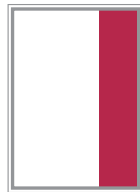
Format 4 59 x 259 mm 470 EUR