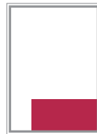
Format 5 124 x 83 mm 470 EUR