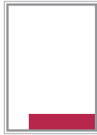
Format 7 124 x 43 mm 210 EUR