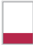
Format 3 189 x 83 mm 600 Euro