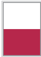
Format 2 189 x 127 mm 900 EUR