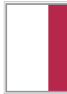
Format 4 59 x 259 mm 470 EUR