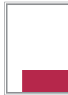
Format 5 124 x 83 mm 470 EUR