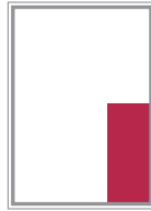
Format 8 59 x 127 mm 320 EUR