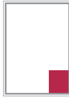
Format 9 59 x 83 mm 200 EUR